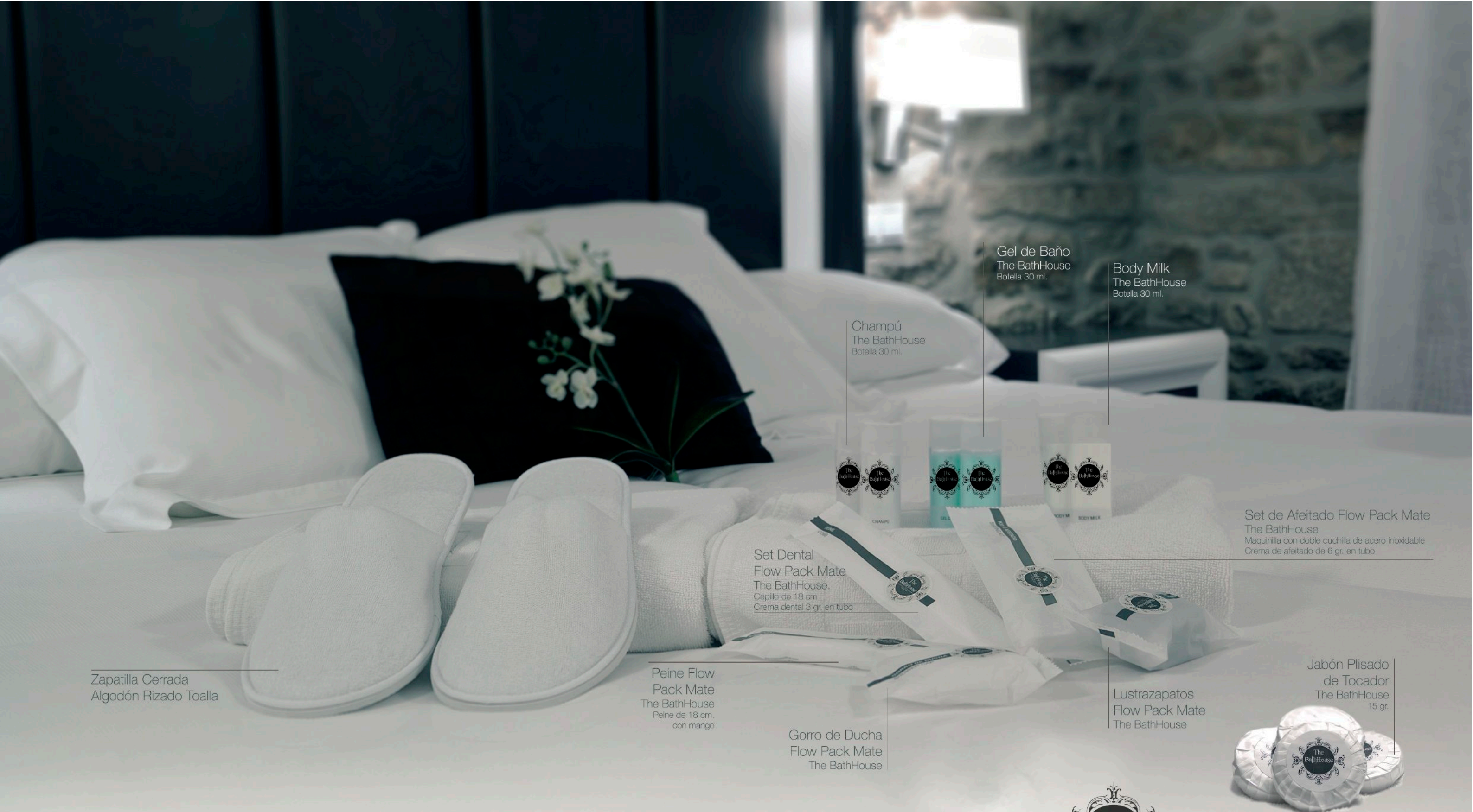
Zapatilla Cerrada Algodón Rizado Toalla