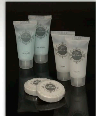
Gel de baño The BathHouse Tubo 20 ml.