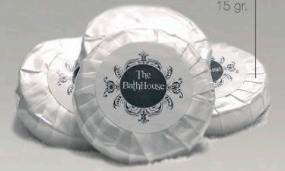
Jabón Plisado de Tocador The BathHouse 15 gr.