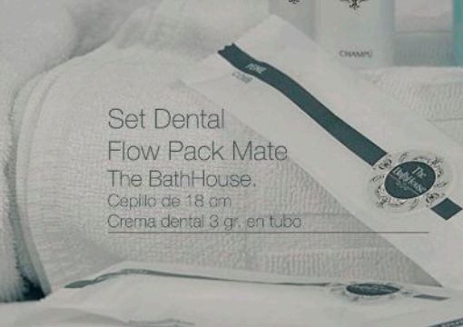
Set Dental Flow Pack Mate The BathHouse. Cepillo de 18 cm Crema dental 3 gr. en tubo